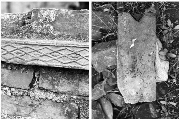
图2 茶店子村落中散落的汉砖