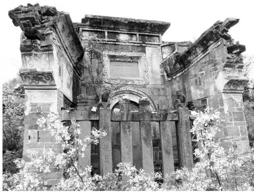
图一 汉滨区关庙镇金华村唐氏墓

安康大部分墓碑楼建于清中后期,迄今发现最早的是建于明崇祯三年的汉滨区关庙镇金华村唐氏墓(图一)。该墓坐东北向西南,人鼻形封土,前宽3.9、高1.8、中长3米;碑楼一座,三开间外八字形,青砖垒砌,重檐庑殿顶,楼檐饰彩绘,前部有碑屏,高3.9、宽3.5、厚3.4米;碑为圆首,页岩质,首饰浅浮雕二龙戏珠图,边栏阴浅刻蔓草纹,碑文楷书,记9行,记载墓主迁徙及家族诸情,并述重砌碑楼之缘由。唐氏墓对研究安康墓碑楼起源具有重要意义。