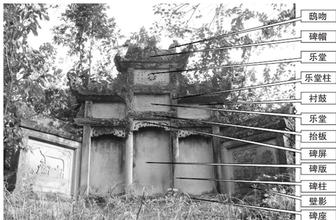
图二 墓碑楼结构图

合墓碑楼、汉白玉墓碑楼等形式。在构造上，十分注重整体与局部之间的协调，每座楼均讲究左右对称、上下平衡；在形体上、轮廓上和层次上给人以疏朗有致、节奏分明的美感。安康墓碑楼一般为柱、间、层构成的组合体，由碑座、碑柱、碑版、抬板、乐堂、碑帽六大部分组成（图二）。横向有开间，竖向有楼层，仿榫卯结构。最简单的为二柱一间，即五镶。“五镶”为：左右碑柱、碑座、碑版和碑帽，两边的抱鼓不计算镶数。若在碑版上加抬板，在碑帽上加碑顶，则为七镶。若在抬板之上正中加‘乐堂’，成为二层楼式，又多出四镶碑石，则称十一镶。有的墓碑在碑柱与抬板之间，另加一块倒‘凹’状挖匾，以增加碑体的结构美，在称呼上并不增加镶数” [6] 。数量最为众多的是四柱三间三重檐，但也存在极为罕见的帝王专用的十柱九间。如：位于紫阳绕溪乡岩峰村的岩峰清墓（图三），封土前现存十柱九间五重檐碑楼一座，碑楼高4.5米，宽7.4米。