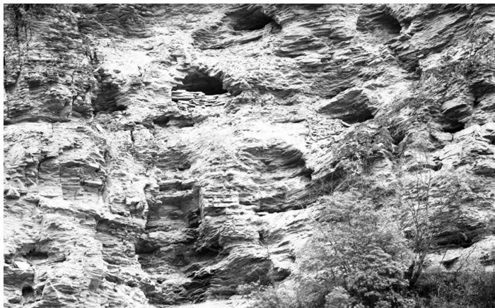
图4 部分局部崖墓形制

洞穴内材木面貌始得逐渐清晰，这是一根从中劈开后又楔合成一块的圆木，略凿成船体形状，可透视长约3米，头北尾南横置于洞穴内基岩上，故又称船棺葬，是迄今陕南巴山北麓现存最为完好的一处悬棺葬。