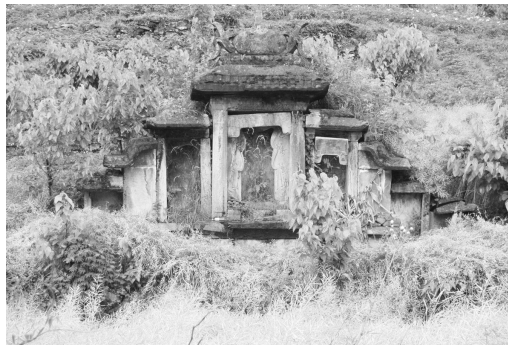
图三 紫阳县绕溪乡岩峰清墓

合墓碑楼、汉白玉墓碑楼等形式。在构造上，十分注重整体与局部之间的协调，每座楼均讲究左右对称、上下平衡；在形体上、轮廓上和层次上给人以疏朗有致、节奏分明的美感。安康墓碑楼一般为柱、间、层构成的组合体，由碑座、碑柱、碑版、抬板、乐堂、碑帽六大部分组成（图二）。横向有开间，竖向有楼层，仿榫卯结构。最简单的为二柱一间，即五镶。“五镶”为：左右碑柱、碑座、碑版和碑帽，两边的抱鼓不计算镶数。若在碑版上加抬板，在碑帽上加碑顶，则为七镶。若在抬板之上正中加‘乐堂’，成为二层楼式，又多出四镶碑石，则称十一镶。有的墓碑在碑柱与抬板之间，另加一块倒‘凹’状挖匾，以增加碑体的结构美，在称呼上并不增加镶数” [6] 。数量最为众多的是四柱三间三重檐，但也存在极为罕见的帝王专用的十柱九间。如：位于紫阳绕溪乡岩峰村的岩峰清墓（图三），封土前现存十柱九间五重檐碑楼一座，碑楼高4.5米，宽7.4米。