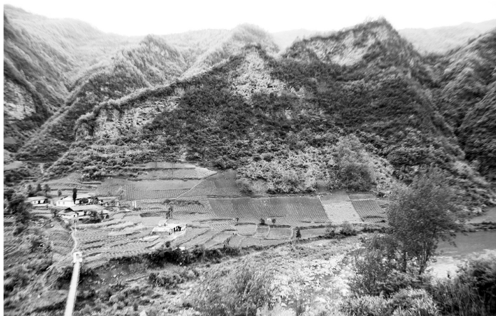
图3 七坪山南北约1公里范围内的河东岸山崖上分布的悬棺崖墓