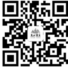
文化安康微博二维码