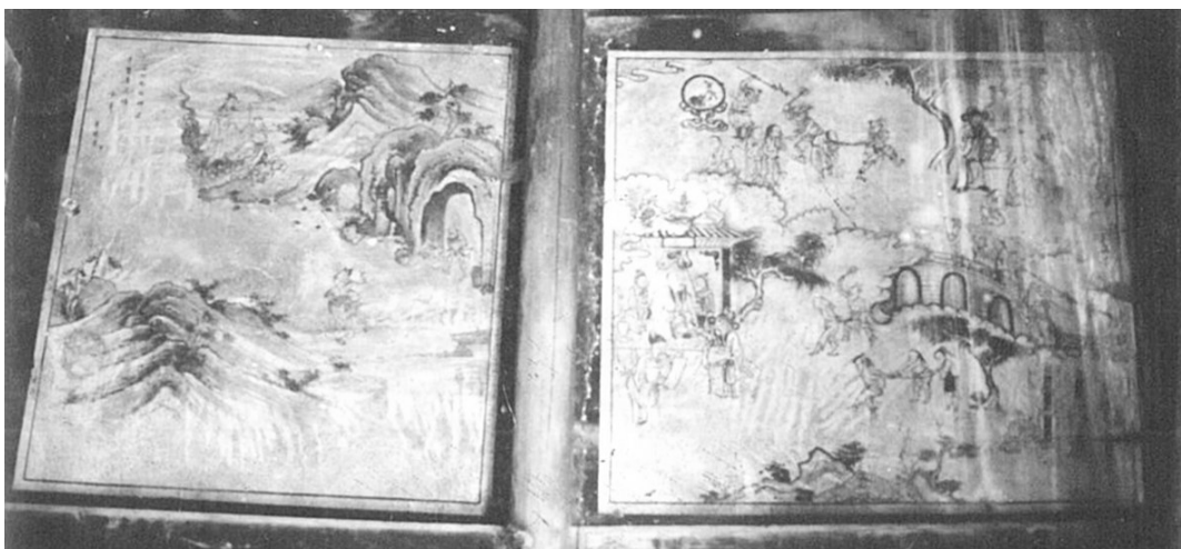
汉阴县漩渦观音堂古庙内保存最完好的两幅壁画

后壁绘海天蜃楼，有山水、人物、建筑等故事情节结构，连壁大幅，远远超过任何卷轴作品的范围。东壁绘图27幅，有山水人物，有青翠苍松，有春兰秋菊、有松鼠葡萄。还有天上人间、阴曹地狱等。西壁绘《西游记》神话故事，共24幅，层层山峦联系着整个画面而延伸到遥远的天边，在荒无人烟而又怪石嶙峋的崎岖小道上，唐僧师徒四人面向西天走去。孙悟空尖嘴猴腮，手持金杵形如意棒；猪八戒猪首人身，肩扛五齿铁耙，腆挺着大肚皮，依傍在唐僧身边；沙和尚青脸短髭，束额散发，挑着行囊，牵着白龙马亦步亦趋。其它如白骨精、牛魔王、红孩妖、黄袍怪、盘丝