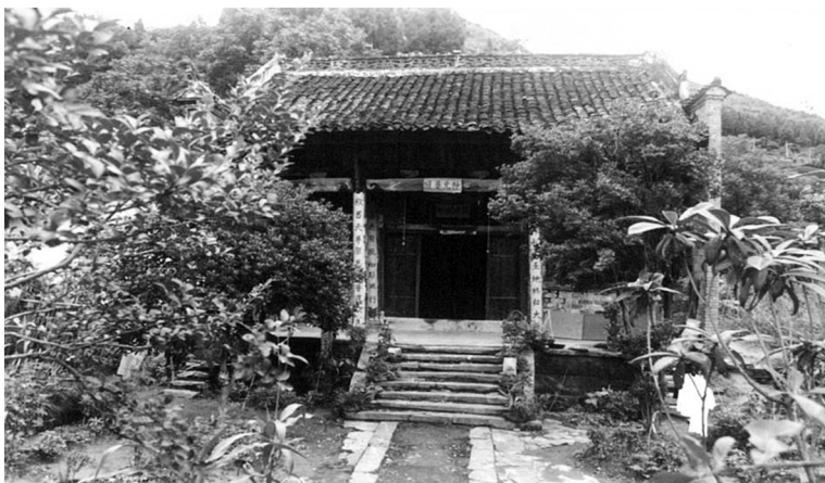
汉阴县漩渦观音堂古庙正殿

憩宿，并赋诗一首，可见当时该庙的规模之宏大，香火之兴旺，闻名之久远，地位之显赫了。