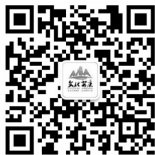
文化安康微信二维码

“文化安康”公共服务平台目前共有“文化安康”公共服务平台官网、“文化安康”公众微信号、“文化安康”公众微博号和《公共文化服务手册》四个子项目。其中，《公共文化服务手册》是云平台的线下应用。同时，“文化安康”还将通过“线上线下”，不断引进新技术、植入新内容、开发新产品，在产品上和内容上，提供优质、高效、便利的公共文化服务，以数字化促进服务的均等化、社会化和标准化，探索和实践现代公共文化服务体系建设的思路、新模式，为全市公共文化服务提供示范和引领。（陈启安）