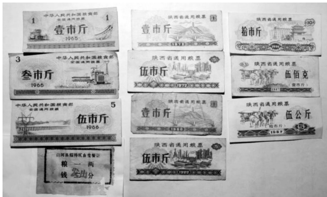
图2 20世纪70年代末招待所食堂餐票