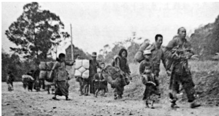
图1 背井离乡的难民

俗话说，天作孽犹可恕，人作孽不可活。1946年，祸国殃民的国民党变本加厉横行乡里，四处拉夫拉差当壮丁扩兵源，有些成年人不愿去，忍痛割爱自断食指（不能扣扳机，故免拉丁）。残酷的现实应