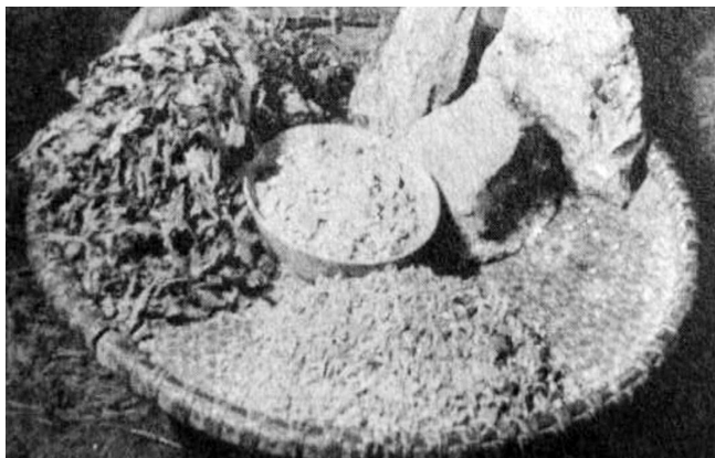
图3 石头状为白垩土

着那句民谣：“挣的钱是保长的，生的娃是老蒋的（蒋介石）”。父亲和我二叔是屈从着轮换着当壮丁。父亲临行前，饮恨吞声地对我兄弟俩说了上述天灾人祸，嘱咐我们牢记耕读传家久，诗书继世长的祖训。