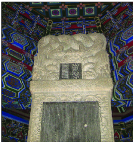
乾隆御制重修万寿寺碑

母后操办六旬和七旬大寿,又两次对寺院进行扩建。这两次扩建,在弘扬中国古典园林文化的基础上,又吸收了西方建筑的风格,兴建了中西合璧造型奇巧的洋式门、金碧辉煌的御碑亭和古朴典雅的三圣殿。修葺后的万寿寺,规模更加宏丽。乾隆二十六年冬十一月,乾隆皇帝亲笔撰写《御制重修万寿寺碑文》称:“我圣母皇太后七秩庆辰适逢斯盛,朕将率亿兆臣庶祝嘏延洪,以圣节崇启经坛,莫万寿寺宜。”